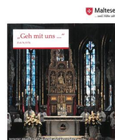
Einladung der Malteser im Erzbistum Köln zur 37. Kevelaer-Wallfahrt am Samstag, 8. Juni 2024

Die Flyer liegen in den Kirchen zum Mitnehmen aus.