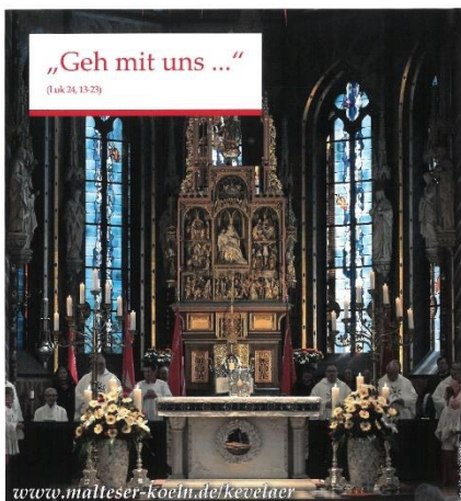
Einladung der Malteser im Erzbistum Köln zur 37. Kevelaer-Wallfahrt am Samstag, 8. Juni 2024

Die Flyer liegen in den Kirchen zum Mitnehmen aus.